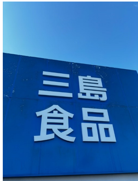
(三島ふりかけ工場見学)

たくさんのふりかけのことを聞きました。最後もふりかけをもらいました。とても楽しかったです。