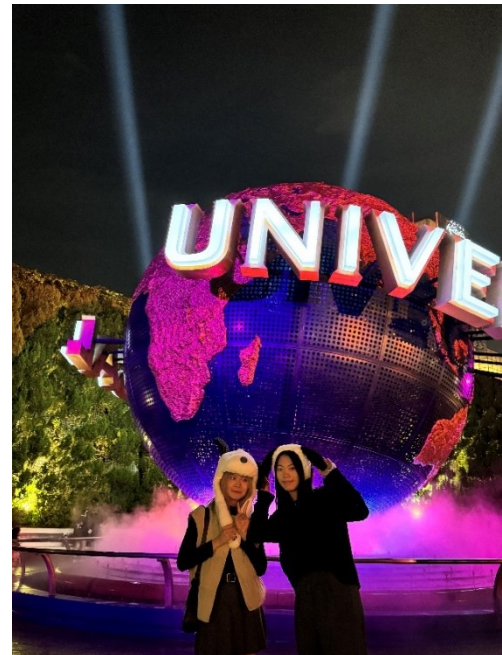
(スヌーピーの帽子をかぶって写真を撮りました)

最近、別科のみなさんと初めて一緒に食事をしました。ご飯を食べながら、別々の国の文化や生活について話して、たくさんの言葉を学びました。