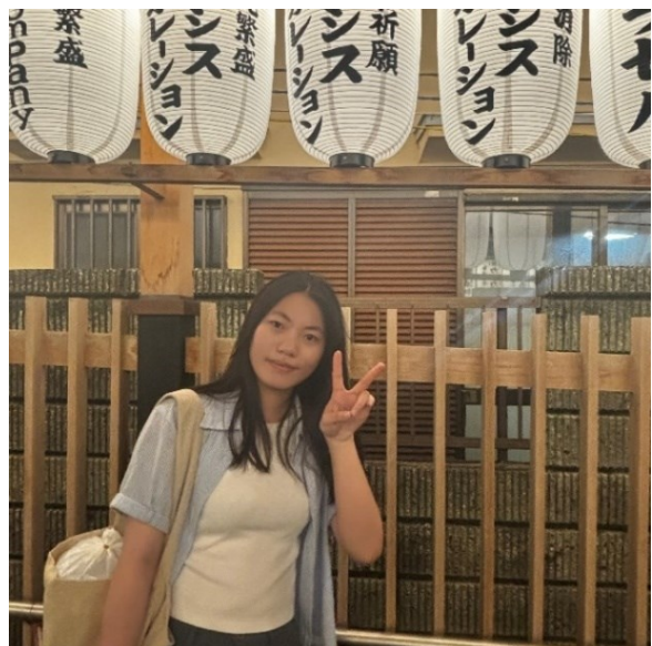
(川越 熊野神社にて)