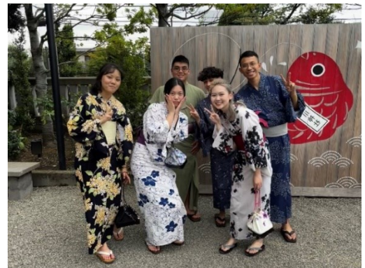
(台湾人と一緒に撮った写真)

これは私にとって特別な体験です。着物を着たことはないですから、あの日はたくさんの写真を撮りました。